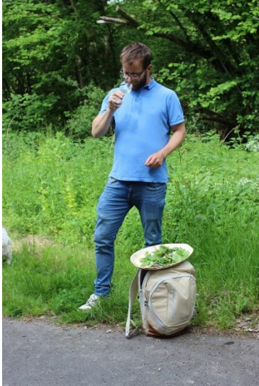
Kräuterwanderung bei einem Partnerbetrieb für Aktionär*innen