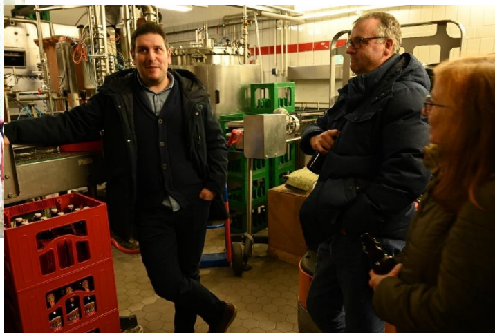
Brauereiführung für Aktionär*innen