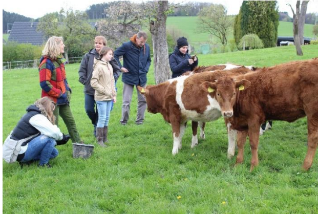
Kuh-Pat*innen-Treffen auf einem Partnerbetrieb