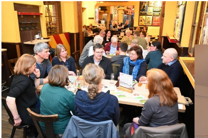
Stammtisch „support your local farmer“: Aktionär*innen treffen Prouzent*innen

Hofkino bei einem Partnerbetrieb, Film „10 Milliarden – wie werden wir alle satt“, Diskussion mit dem Regisseur